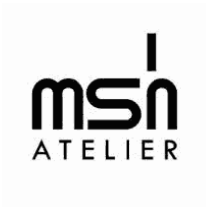
MSH Atelier, Dhaka, Bangladesh.